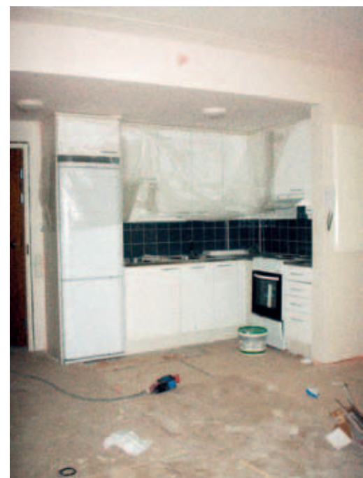
Aleksanterinkaari 6:ssä jo yhdessä asunnossa paikoillaan oleva mallikeittiö näyttää suuntaa alkuvuodesta käynnistyville kalusteasennuksille.